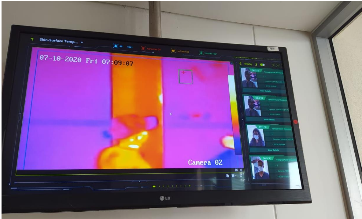
ENTRADA PISO 2